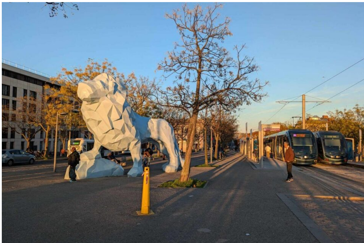
La place Stalingrad et son célèbre lion.